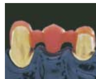
Ajuste pasivo de colado sobre un puente en técnica de galvanización.