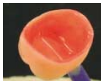
Superficie lisa de la corona primaria