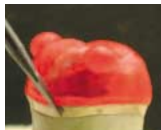
Después de recolocar, hacer los ajustes finos del modelo con un instrumento adecuado.