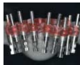
Patrón de Implante traspaso