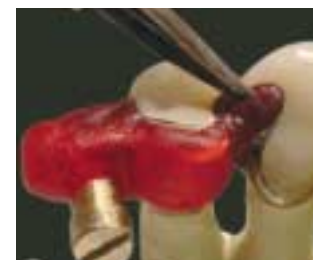
Técnica de unión