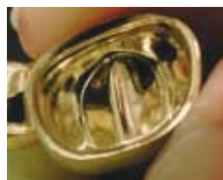
El resultado colado