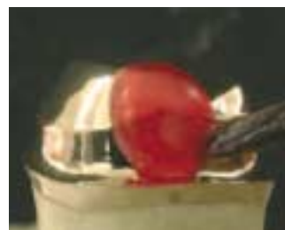
Construcción de un modelo de corona telescópica, usando la técnica del pincel.