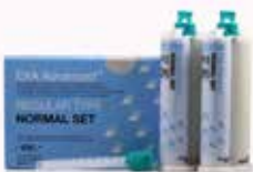
EXA Advanced Regular Fraguado normal

Material de impresión de silicona de adición