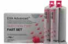
EXA Advanced Injection Fraguado rápido