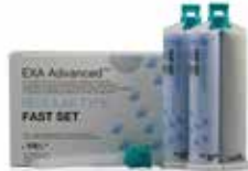
EXA Advanced Regular Fraguado rápido