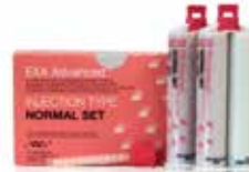
EXA Advanced Injection Fraguado normal